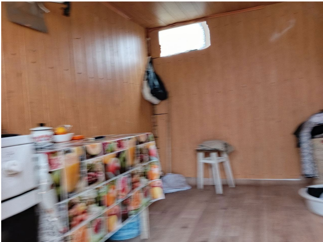
POVA 6 Neo