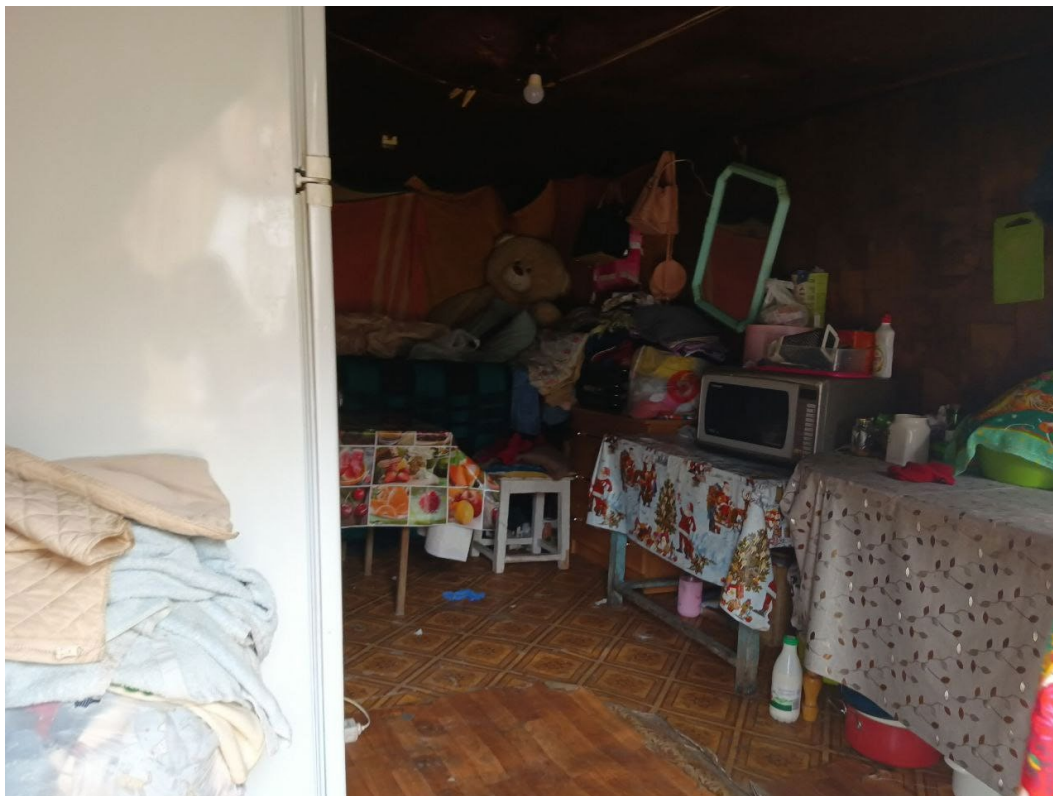
POVA 6 Neo