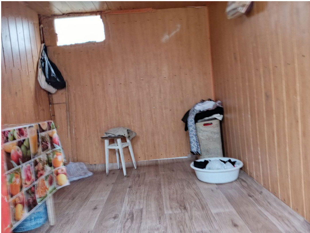
POVA 6 Neo