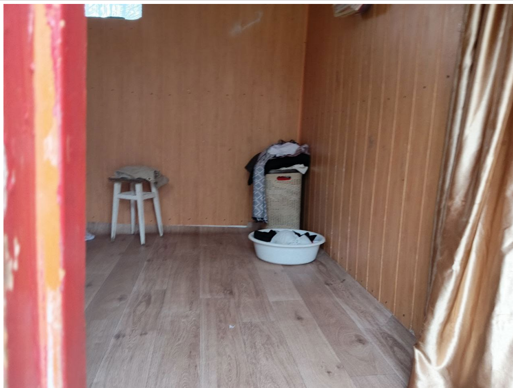
POVA 6 Neo