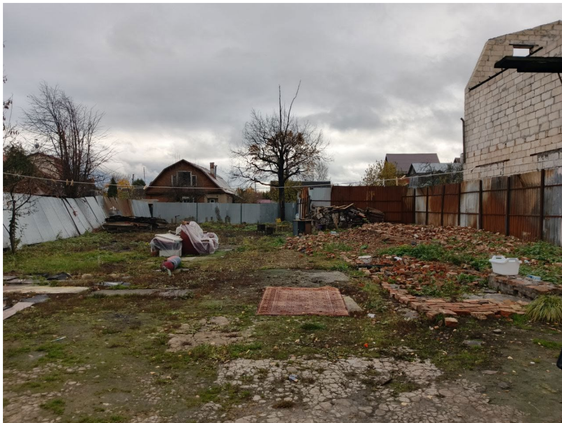
POVA 6 Neo