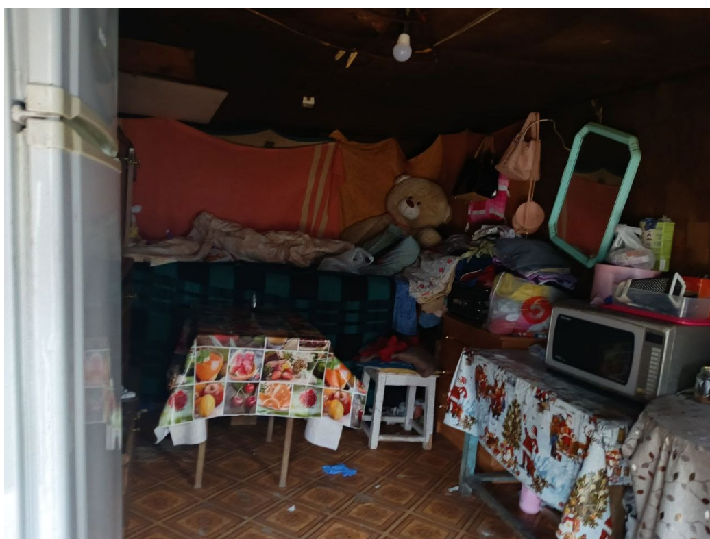
POVA 6 Neo