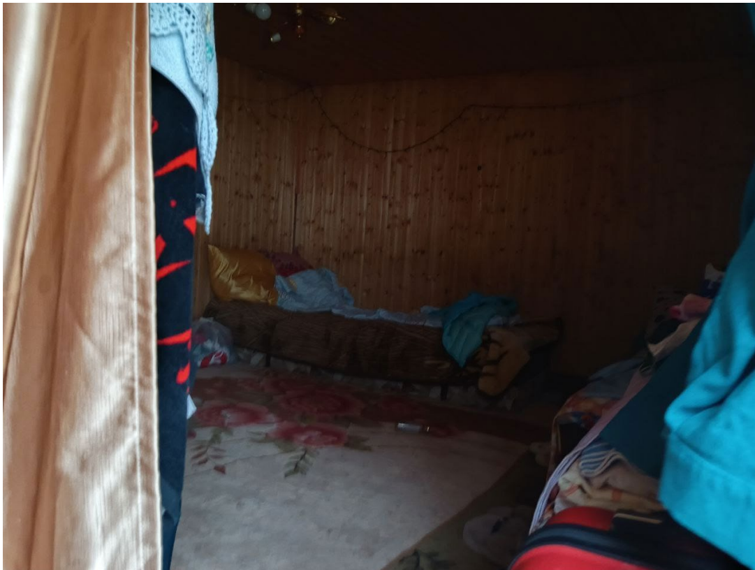
POVA 6 Neo