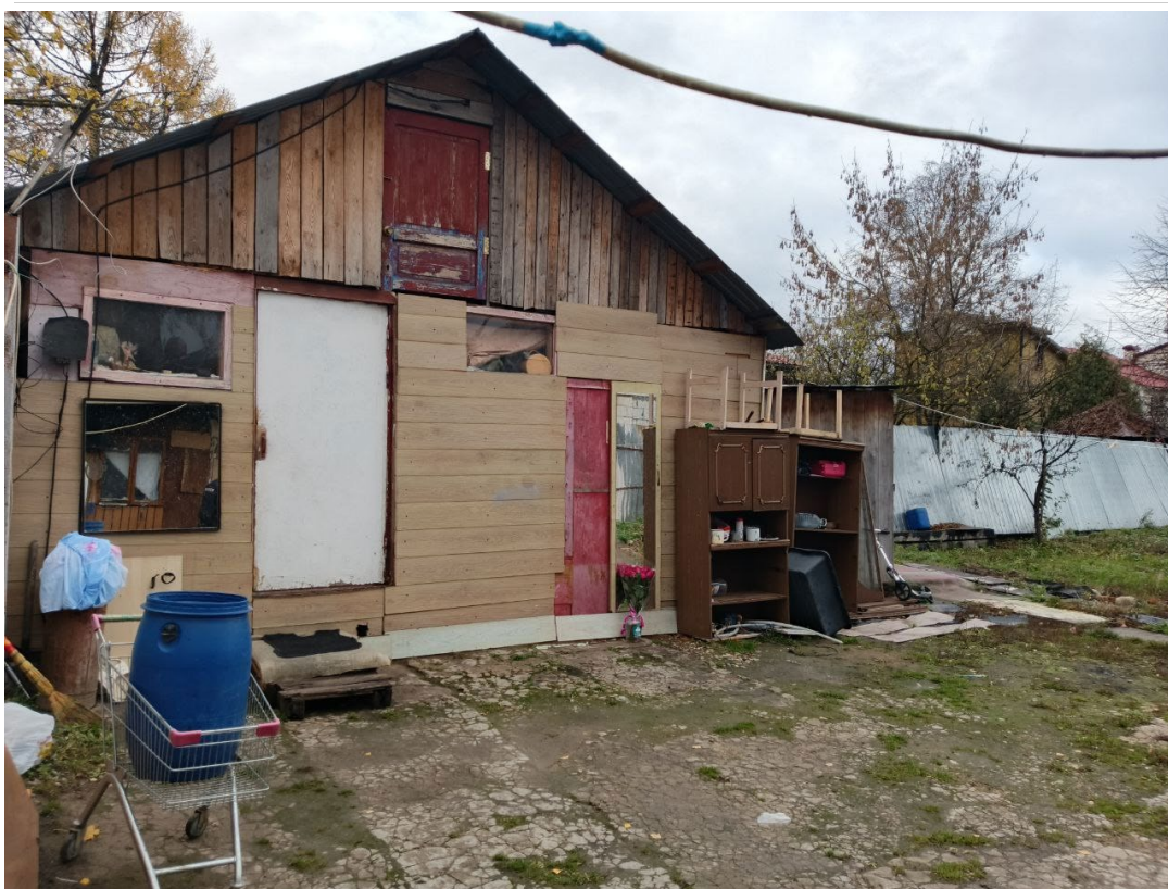
POVA 6 Neo