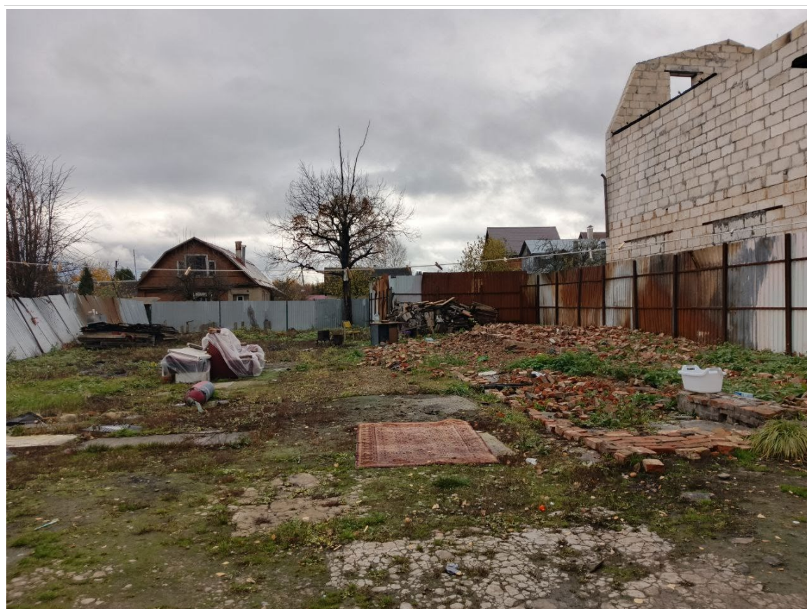
POVA 6 Neo