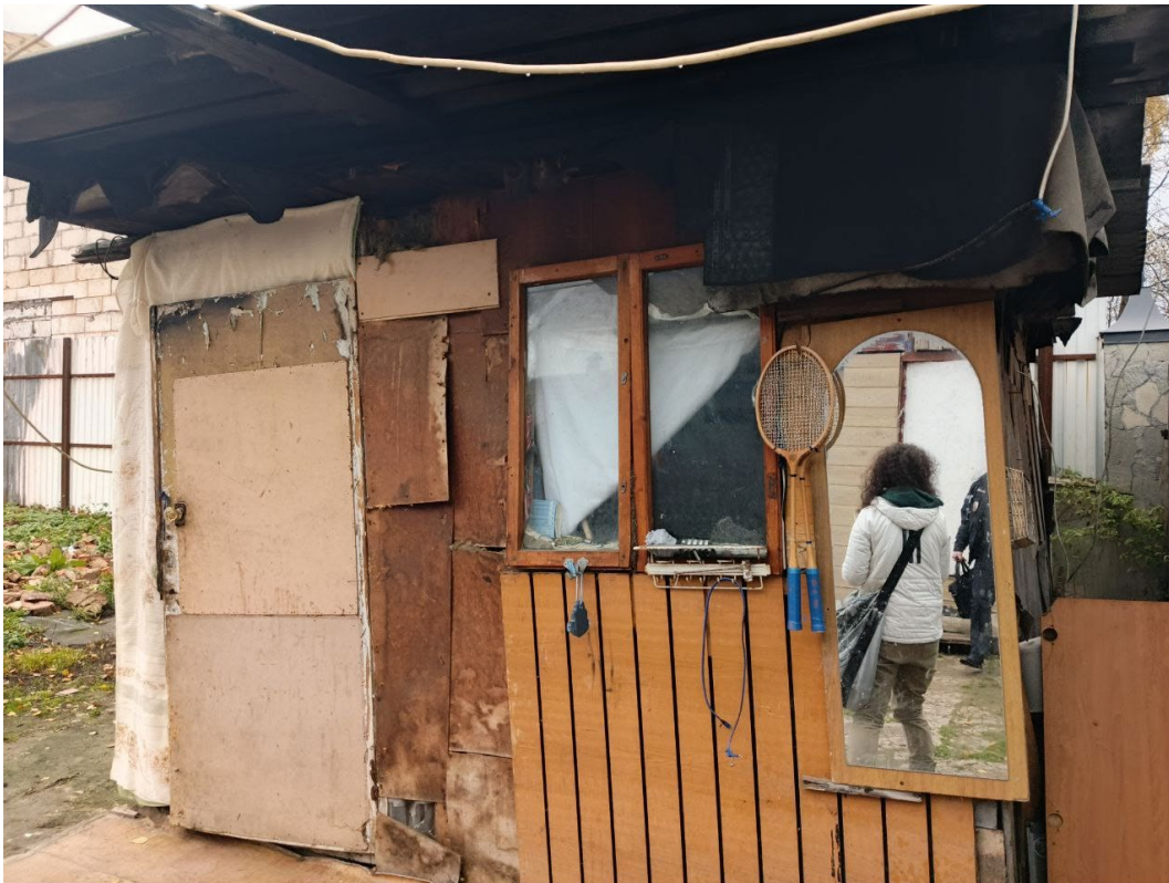
POVA 6 Neo