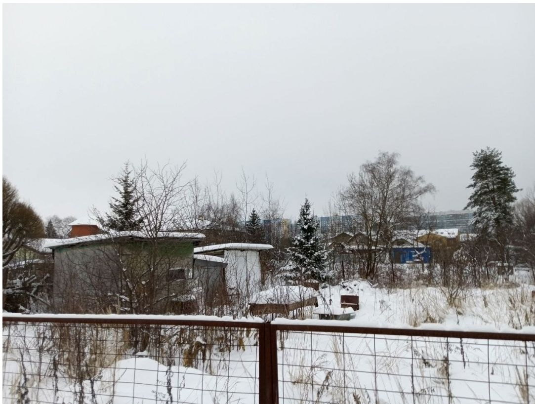
POVA 6 Neo