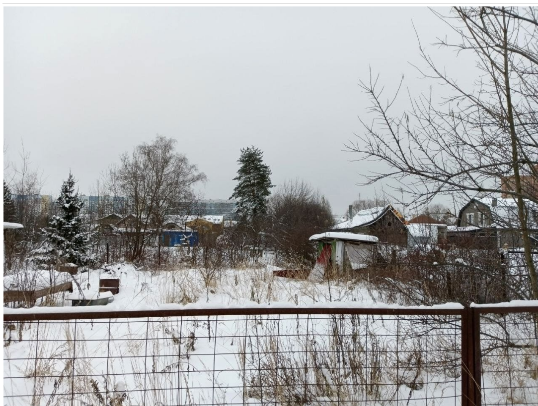
POVA 6 Neo