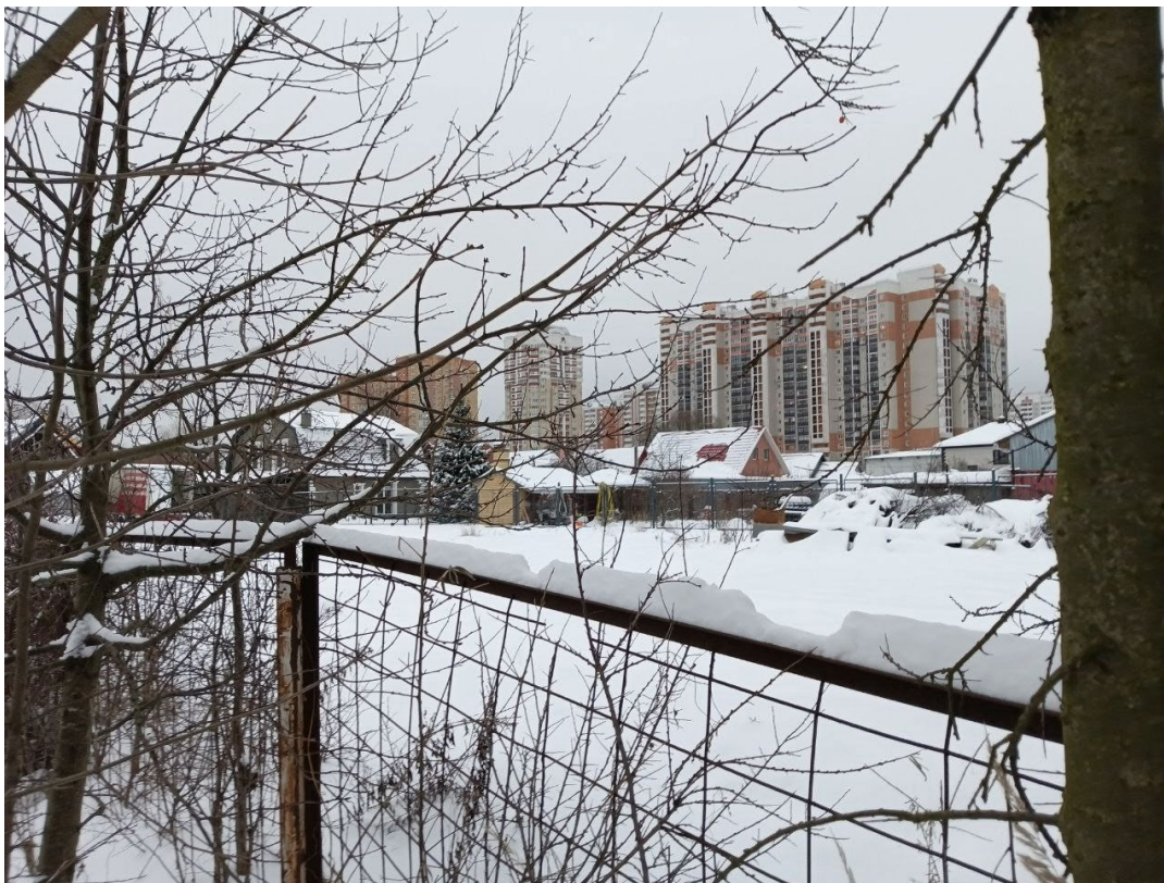
POVA 6 Neo