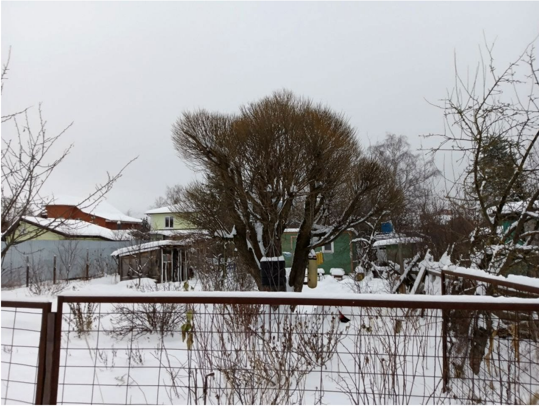
POVA 6 Neo