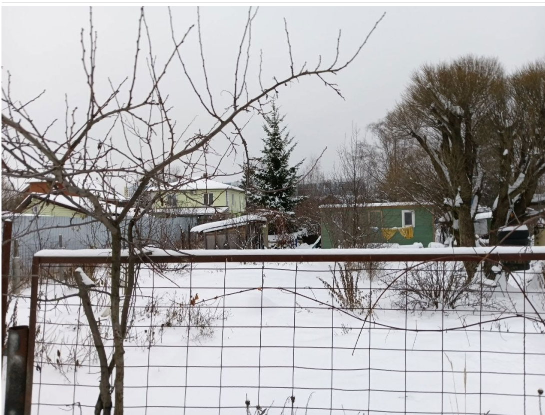
POVA 6 Neo