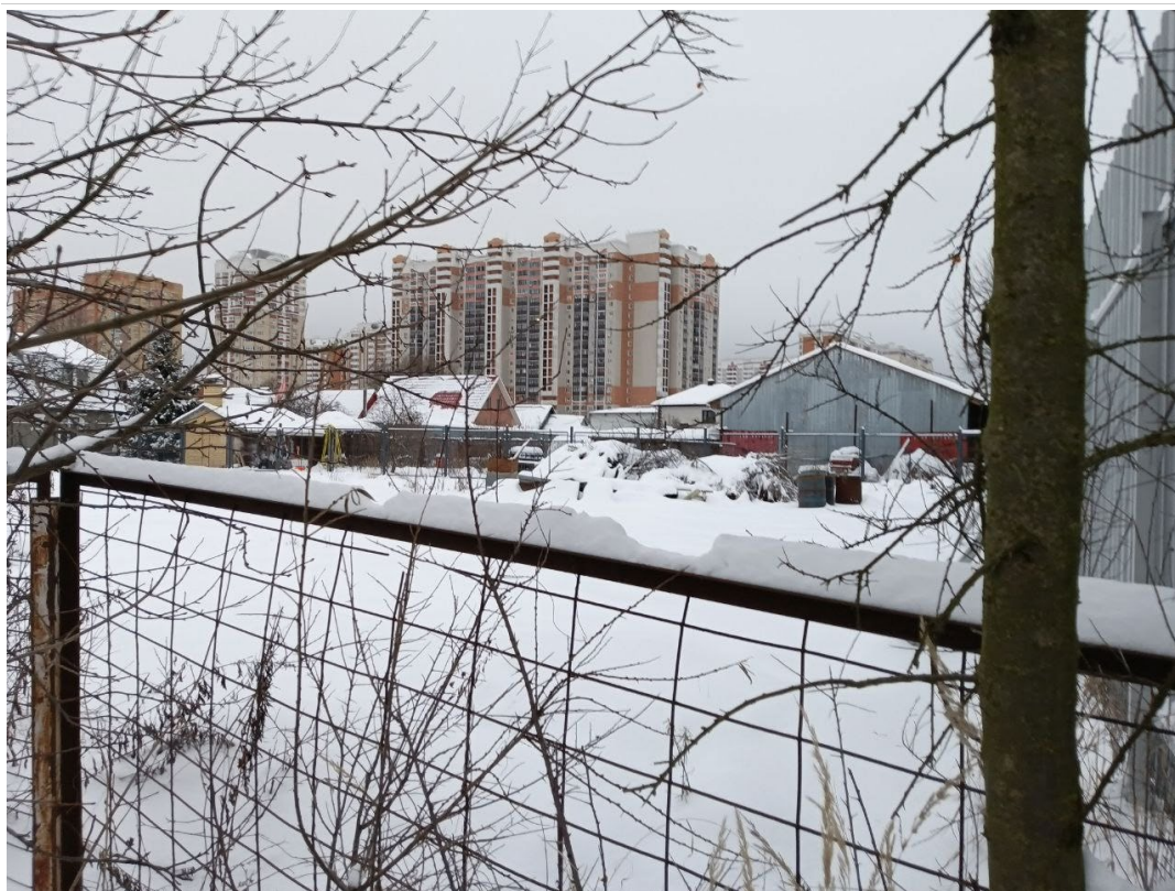
POVA 6 Neo