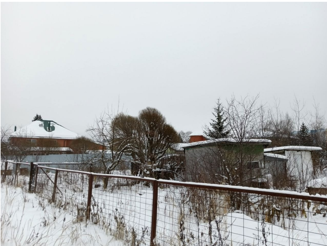
POVA 6 Neo