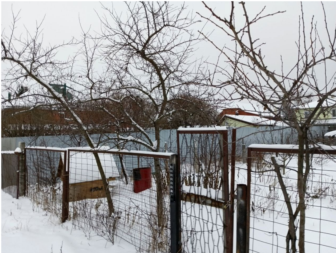
POVA 6 Neo